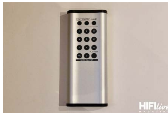
El mando a distancia del K1X cuenta con botones en ambas caras